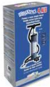
11x22x h 45 cm

per manometro vedi SP125/1 e SP90 a pag 10 for the gauge meter see SP125/1 or SP90 in page 10